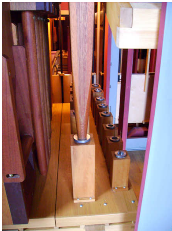
. . . und nachher