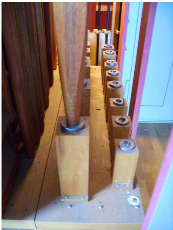
Blick ins Groß-Pedal - vorher -